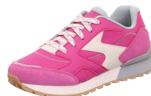
KIDS / TEENS