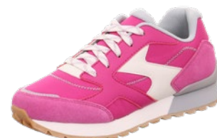
KIDS / TEENS