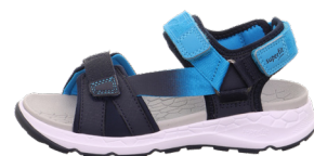
KIDS / TEENS