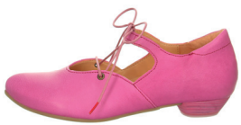
DRESS CASUAL DAMEN