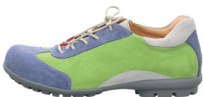
DRESS CASUAL HERREN