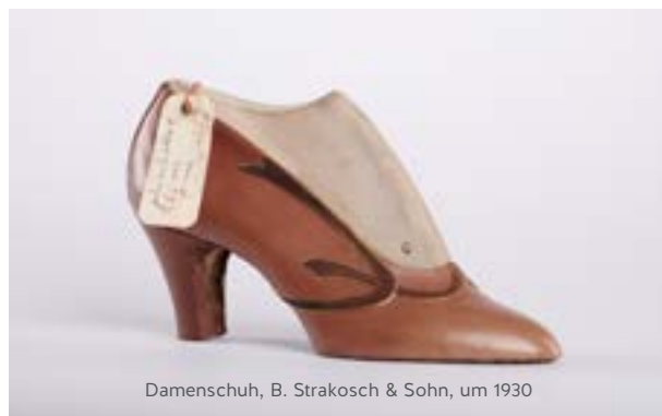
Damenschuh, B. Strakosch & Sohn, um 1930