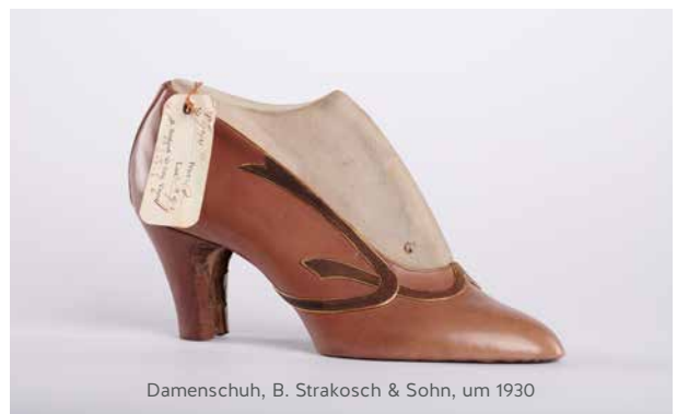
Damenschuh, B. Strakosch & Sohn, um 1930