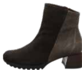
DAMEN DRESS CASUAL